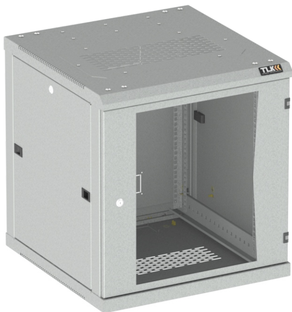
TWC-126060-R-G-GY Настенный односекционный шкаф 19", 12U, Ш600хВ636хГ600 мм, в собранном виде, серый