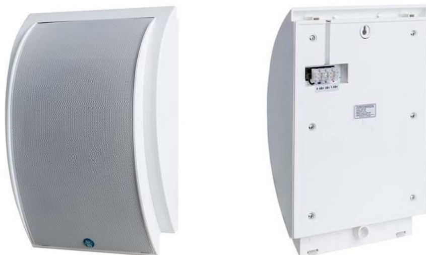
Рис. 1. Внешний вид громкоговорителя.

Внешний вид громкоговорителя показан на рис. 1.