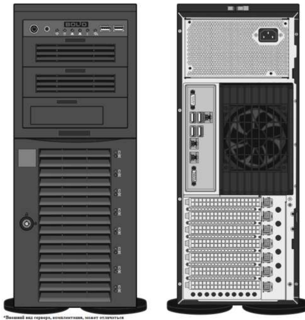
Рисунок 1. Конструкция системного блока*.

2.3 Конструкция системного блока представлена на рис.1: