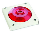
МАЯК-220-КПМ1-НИ оповещатель комбинированный, металлический корпус, наружное исполнение