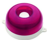
МАЯК-12-КП, МАЯК-24-КП оповещатель комбинированный